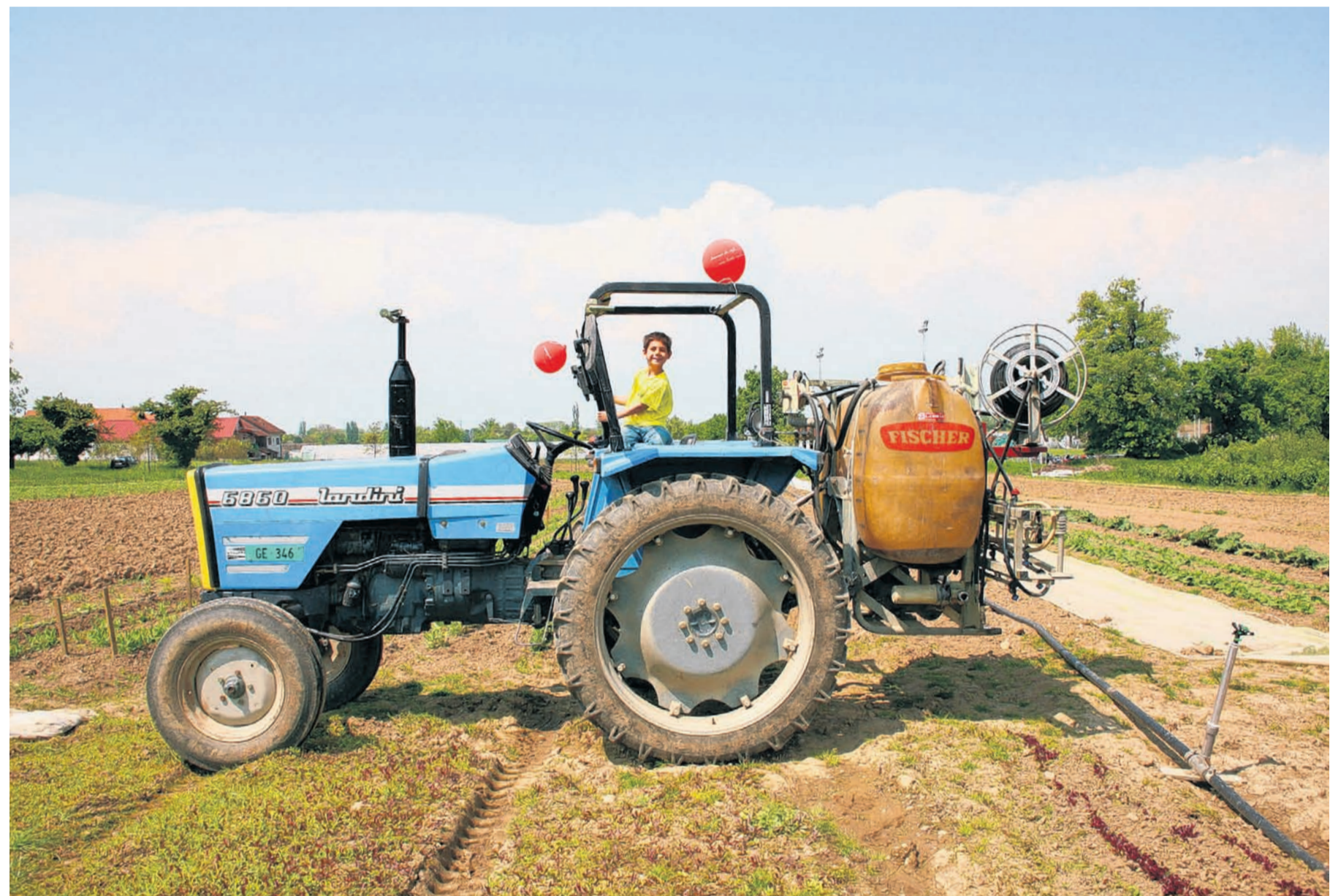
Auf dem Traktor in Landecy: «Beweisen, dass die Agriculture contractuelle auch in grösserem Massstab möglich ist.»

Von Bettina Dyrtrich (Text)